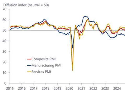
Indicateurs d'activité PMI en zone euro

Performances dividendes réinvesties arrêtées au 22 novembre 2024.